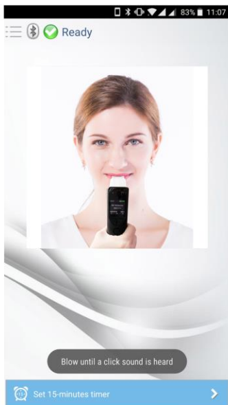
Photo taking during the test