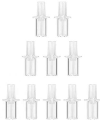
10 Pieces Mouthpiece